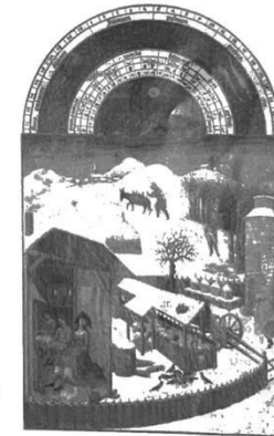
Was erzählt dieses alte Bild vom Leben der Menschen im Winter?

Und was macht die Gänsehaut ? In früherer Zeit hatten die Menschen viel mehr Körperhaare – fast wie ein Affenfell. Wenn es kalt war, richteten kleine Muskeln die Härchen auf. Wie ein Pullover hielten die Härchen damit die warme Luft zwischen dem Fell und dem Körper. Heute haben wir weniger Haare, aber die kleinen Muskeln sind noch da. Sie wollen ein Fell aufstellen, das wir nicht mehr haben.