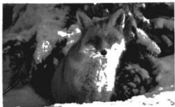
Vielen Säugetieren wächst ein dichteres Fell. Manche fressen sich eine dicke Fettschicht an.

Wie sind Tiere vor der Kälte im Winter geschützt?