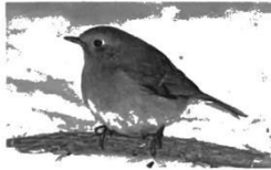
Vögel bekommen ein dichteres Federkleid. Wenn es kalt ist, plustern sie ihr Gefieder auf.

Was meint eigentlich der Wetterbericht mit gefühlter Temperatur?