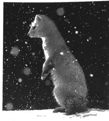
Es war eine helle Winter Nacht. Der kleine Marder ...

Sie wiegt fast nichts. Fang sie auf: eine, zwei, hundert Schneeflocken. Du spürst ihr Gewicht nicht. Wenn du unzählbar viele zu einem Schneeball rollst, spürst du sein Gewicht. Leg ihn auf eine Waage. Auch beim Schneeschieben merkst du, wie schwer Schnee sein kann. Unter einer Schneelast können sogar Äste von den Bäumen brechen.