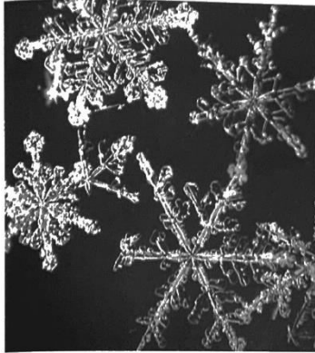
Jeder Eiskristall hat sechs Strahlen, und doch ...

→ Schneeflocken bestehen aus winzigen Eiskristallen. Kein Eiskristall gleicht dem anderen, aber sie sind immer sechseckig. Die Eiskristalle auf diesem Foto sind sehr stark vergrößert. In Wirklichkeit sind sie nur 3mm lang: ❄️